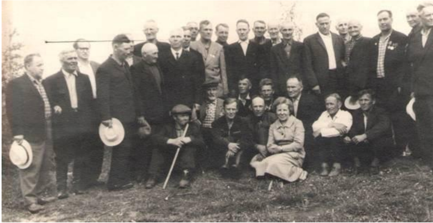
Первый слёт бойцов и командиров отряда «Красный партизан». Посёлок Калевала 23 – 24 июля 1967 года